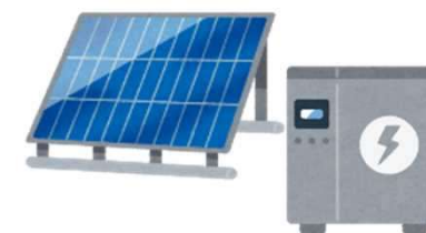
再生可能エネルギー設備

お問合せ先： 環境省環境再生・資源循環局廃棄物適正処理推進課浄化槽推進室 電話：03-5501-3155