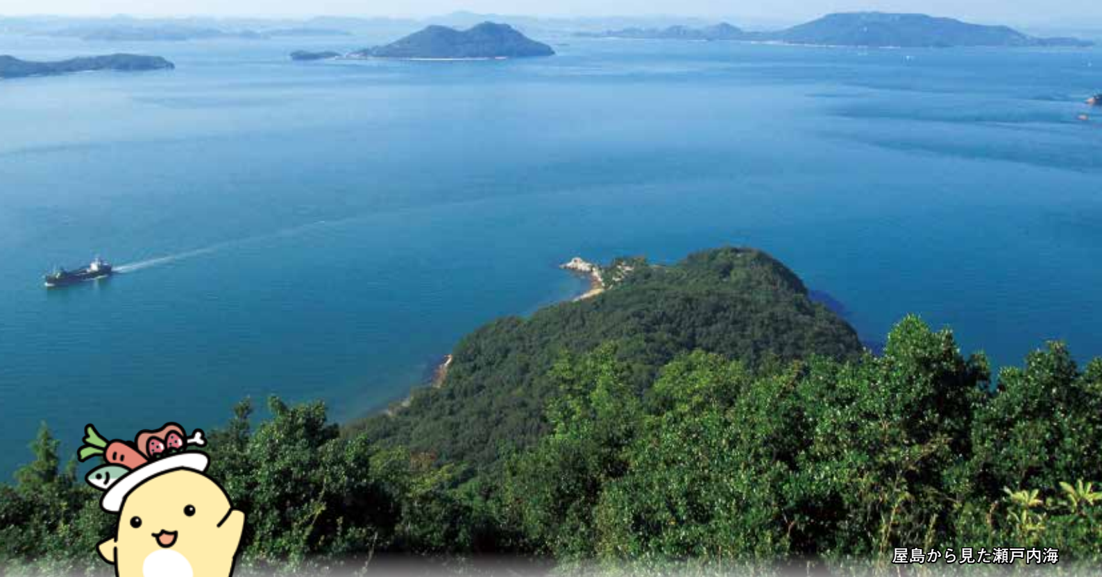
屋島から見た瀬戸内海