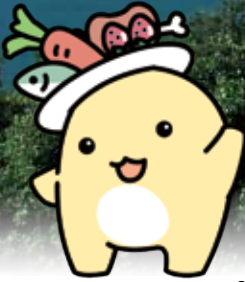
スマート・フードライフ推進キャラクター「たるとる」